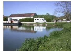
Aires de services et stationnements dans l'Yonne